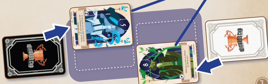
Sorciers du premier Duel