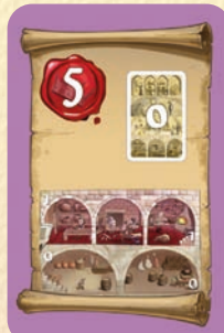
Pas étages 0 et 1

3 points si aucun de vos Favoris n'est aux étages 2 et 3