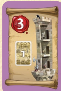
1 Favori au cachot

5 points si aucun de vos Favoris n'est aux étages 0 et 1