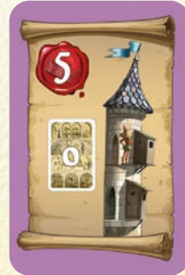
0 Favori aux WC

3 points si un homme est couronné Roi (ni Ouaf ni le Bouffon)