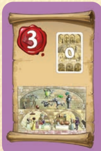
Pas étages 2 et 3

5 points si aucun de vos Favoris ne se trouve dans un WC