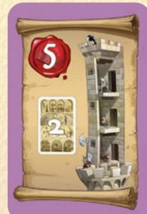
2 Favoris au cachot

3 points si exactement 1 de vos Favoris est dans les Cachots