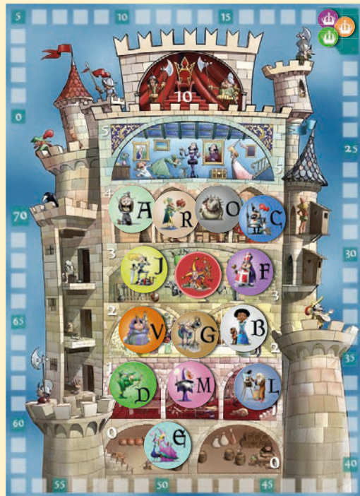
Partie à 3 joueurs. Tous les joueurs ont placé 4 personnages. Éloïse n'a été placée par personne et se retrouve à l'étage 0.

À 8 joueurs : chaque joueur place 2 Personnages, sauf les 3 derniers joueurs qui n'en placent qu'un seul. Les 3 derniers joueurs marquent chacun 3 points de victoire de compensation.